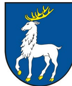
Obrázok 2 Erb obce Horovce

Erb obce Horovce tvorí v modrom štíte kráčajúci strieborný jeleň v zlatej zbroji.