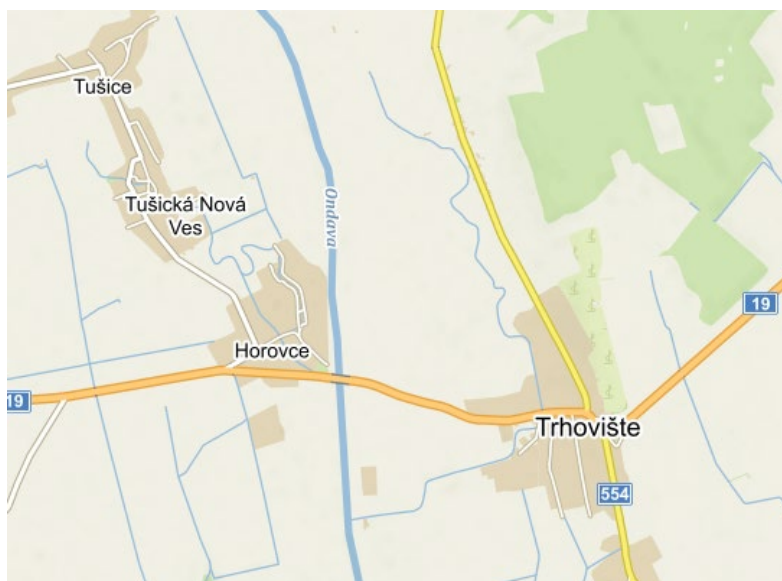
Obrázok 1 Mapa polohy obce

Obec Horovce leží tesne pri brehoch rieky Ondavy zo západnej strany, uprostred Východoslovenskej nížiny na agradačnom vale Ondavy, juhozápadne od okresného mesta Michalovce a severovýchodne od okresného mesta Trebišov v Košickom samosprávnom kraji. Susedí s katastrálnym územím obce Vojčice, s katastrálnym územím obce Tušická Nová Ves, Moravany, Trhovište a Bánovce nad Ondavou.